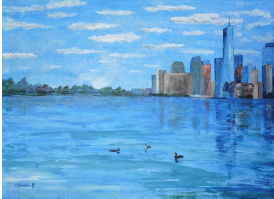
„Manhattan in early autumn“, oil on canvas, 53 x 72,7 cm