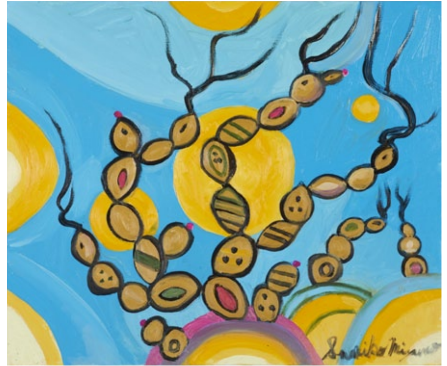
„World of microorganisms (yeast) №44“, oil on canvas, 60,6 x 72,7 cm