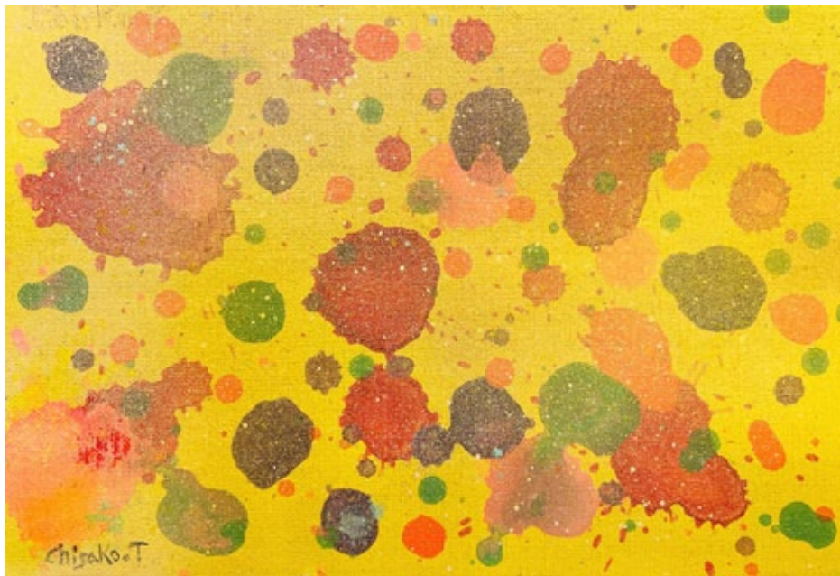
„Spring fruit A“, acrylic on canvas, 15,8 x 22,7 cm