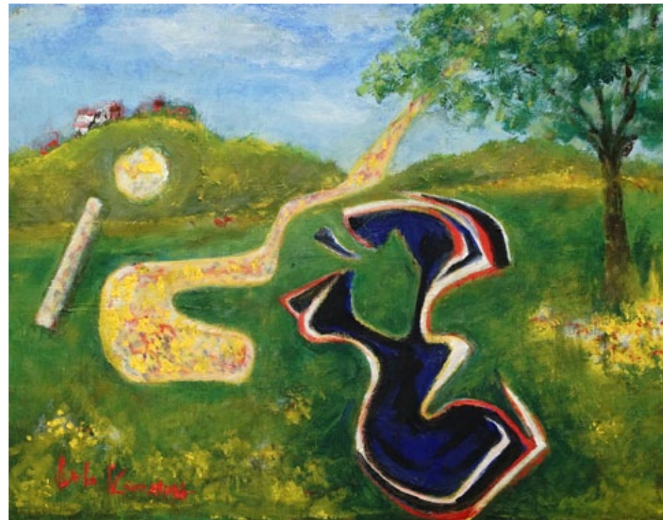
„I'm alive“, oil on canvas, 31,8 x 40,9 cm