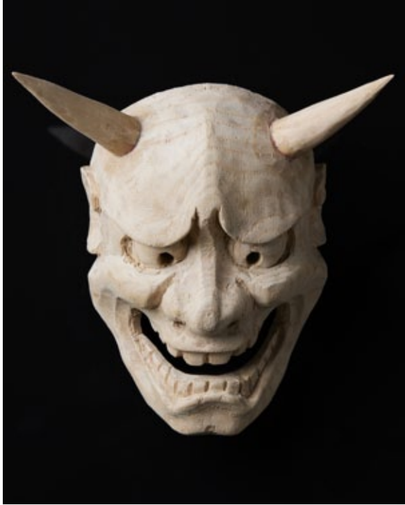
„Yashamyoo“, wood, 20 x 12 x 3 cm