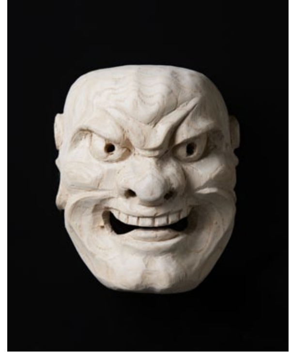
„Angry“, wood, 20 x 12 x 3 cm