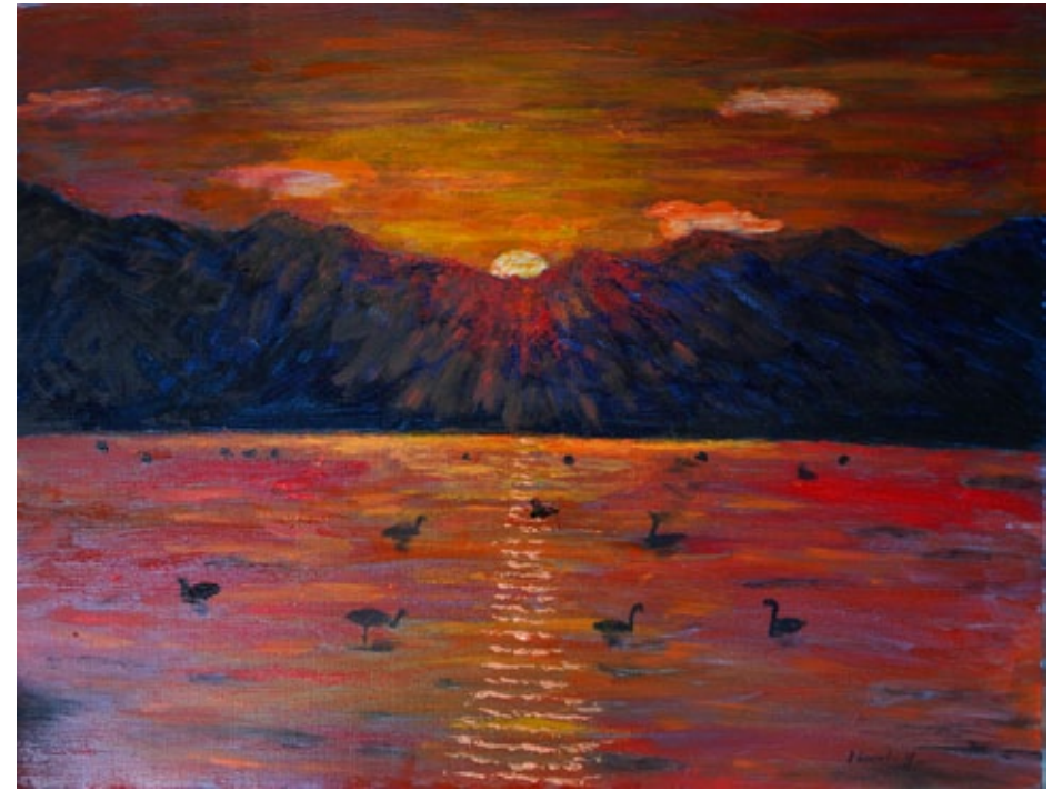
„Affection N°69“, oil on canvas, 50 x 65,2 cm