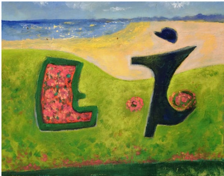
„Regret“, oil on canvas, 31,8 x 40,9 cm