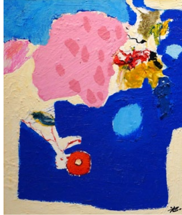
„It's me“, oil on canvas, 45,5 x 37,9 cm