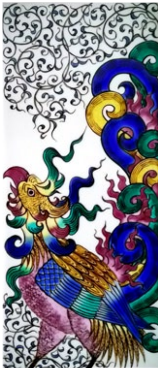
„Legendary birds: Simurgh“, Kutani pottery, 27 x 12 cm

YUKO HORIE, seeks to harmonize Turkish and European art and culture with Kutani ware.