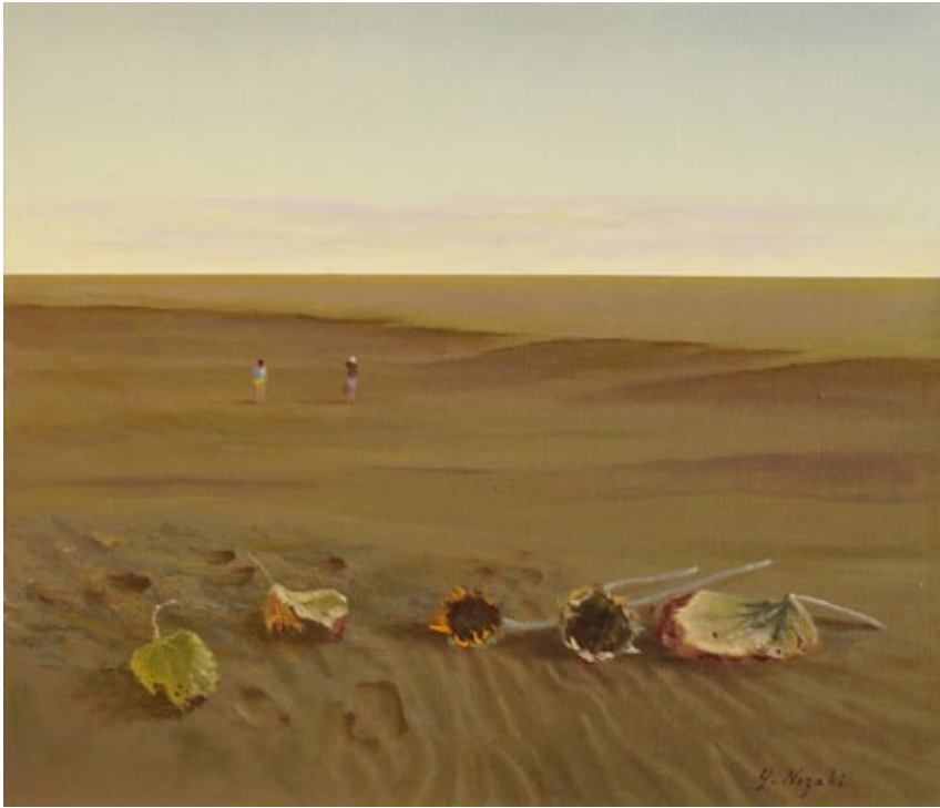
„Late summer“, oil on canvas, 45,5 x 53 cm