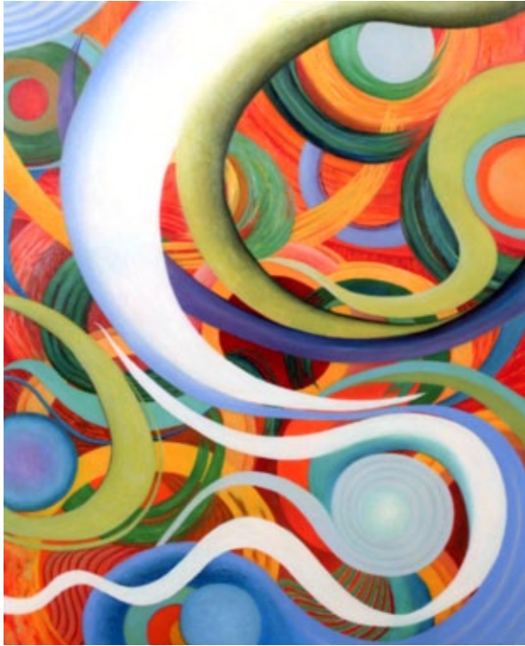
„Fortune“, oil on canvas, 65,2 x 53 cm