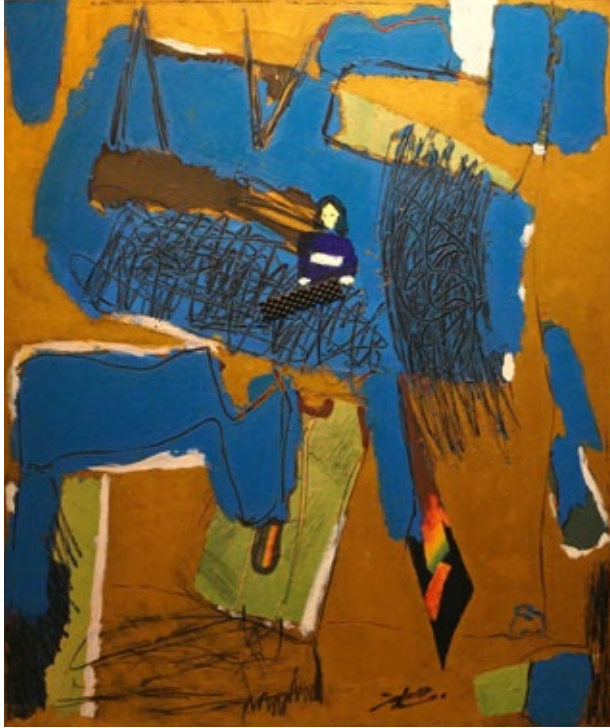
„Rendezvous with Rama“, oil on canvas, 72,7 x 60,6 cm