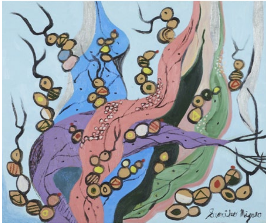
„World of microorganisms (yeast) №43“, oil on canvas, 60,6 x 72,7 cm