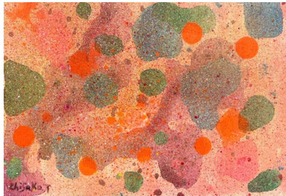
„Autumn cityscape“, acrylic on canvas, 15,8 x 22,7 cm