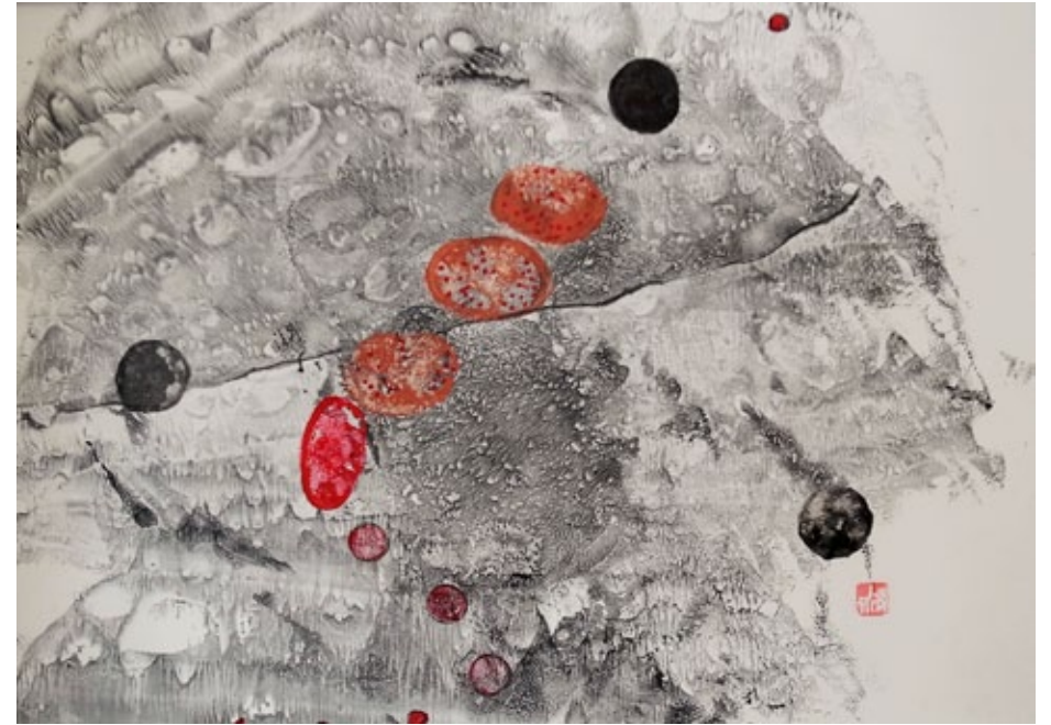
„Inori“, India ink, mineral paint on Japanese paper, 19 x 26,5 cm