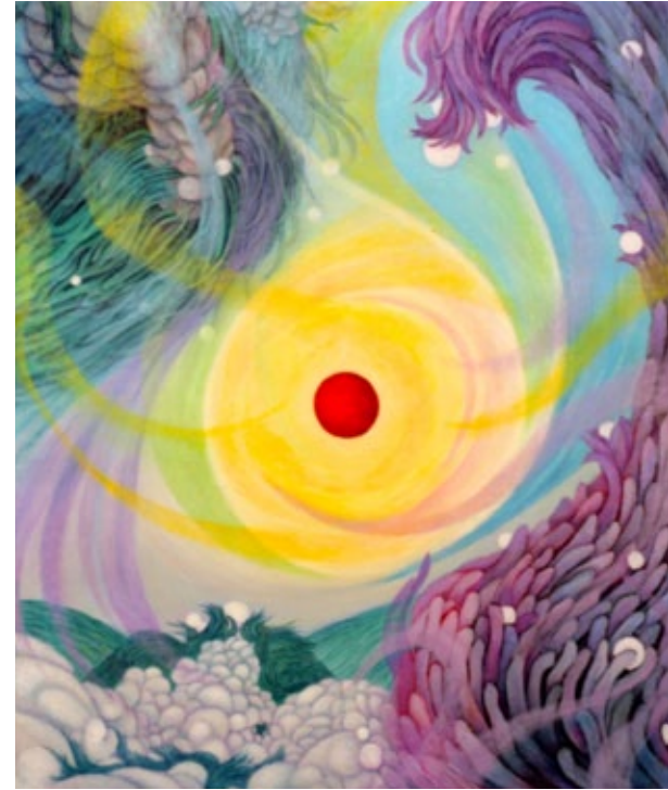
„Refreshing“, oil on canvas, 45,5 x 31,8 cm