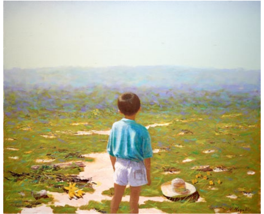
„Spring breeze“, oil on canvas, 60,6 x 72,7 cm